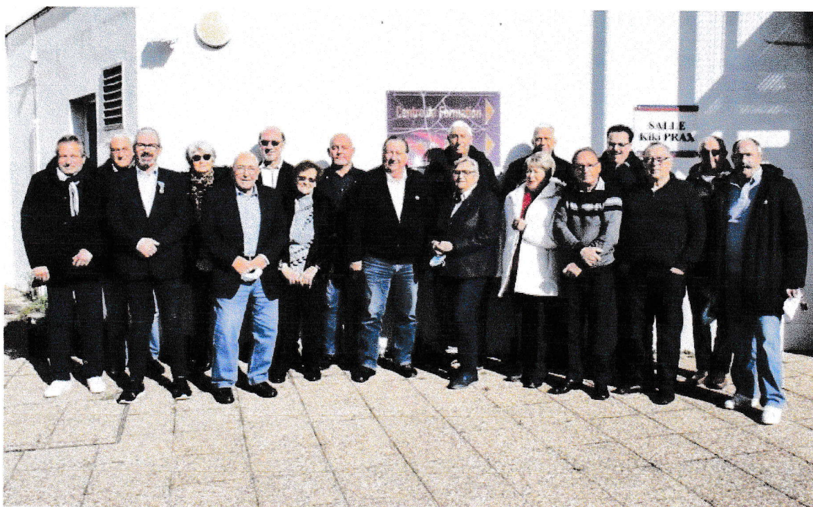
Le Comité Départemental des Médailleurs de la Jeunesse, des Sports et de l'Engagement Associatif (2021-2024)

L'ordre du jour étant épuisé la Présidente lève la séance à 11h45.